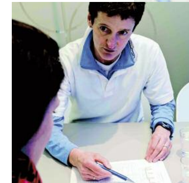
Alle Ergebnisse werden mit Ihnen ausführlich besprochen.