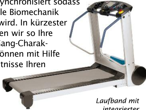
Laufband mit integrierter Drucksensorplatte

Auf einem Laufband mit integrierter Drucksensorplatte ermitteln wir Ihren persönlichen Bewegungsablauf. Das System ist zusätzlich mit zwei HDKameras synchronisiert sodass die individuelle Biomechanik ganz erfasst wird. In kürzester Zeit analysieren wir so Ihre persönliche Gang-Charakteristik und können mit Hilfe dieser Erkenntnisse Ihren Bewegungsablauf optimieren.