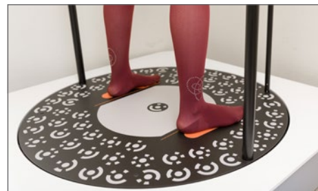
Moderne Technik für ein exaktes Vermessen der Beine.

wird, werden die Beine vermessen. So erhält der Kunde die beste Passform für seine Beine. Die Strümpfe sind pflegeleicht, gut anzuziehen und strapazierfähig. In einem persönlichen Beratungsgespräch ermitteln wir die richtigen Strümpfe für